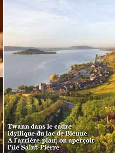
Twann dans le cadre idyllique du lac de Biene. A l'arrière-plan, on aperçoit l'île Saint-Pierre