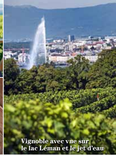
Vignoble avec vue sur le lac Léman et le jet d'eau